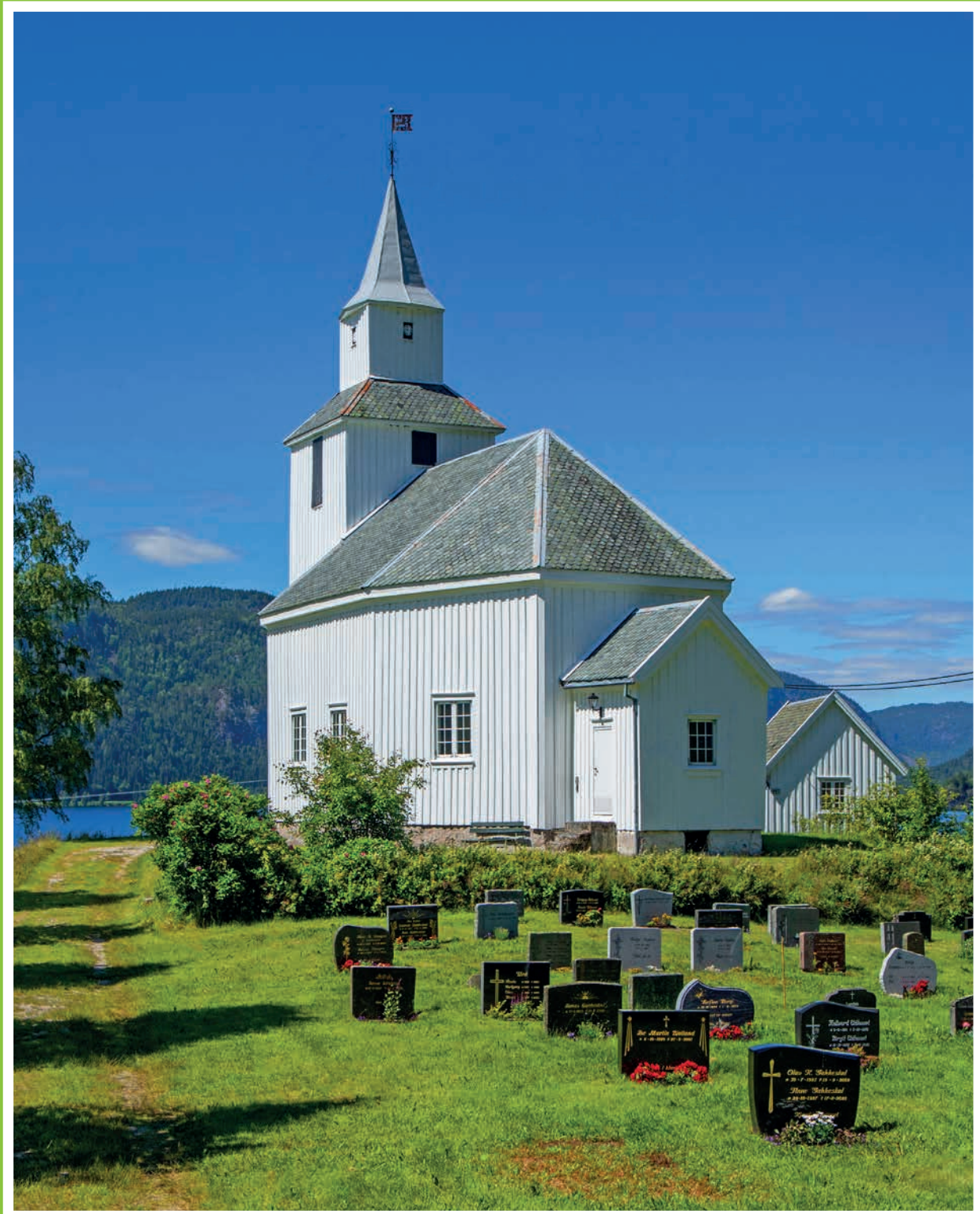
Sandnes kirke i Åraksbø.

Avsender: Bygland kyrkjekontor, Sentrum 18, 4745 Bygland